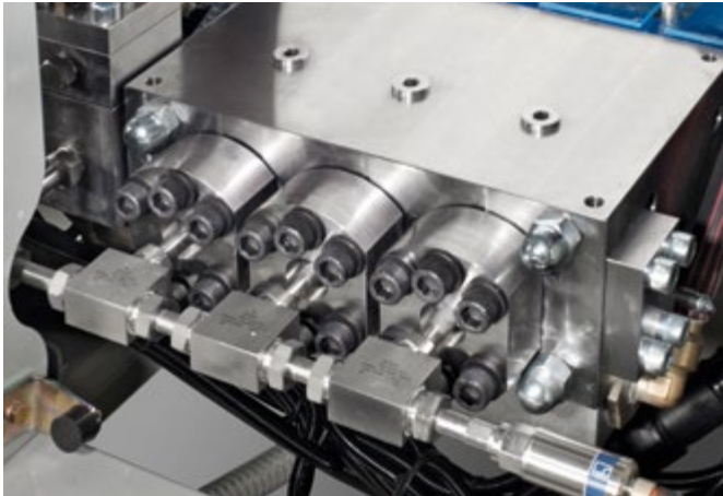
功率更大，更安全: 全启式安全阀的超高压泵