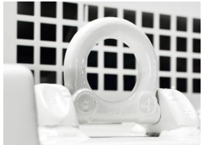
四个吊眼，可在建筑工地上快速移动