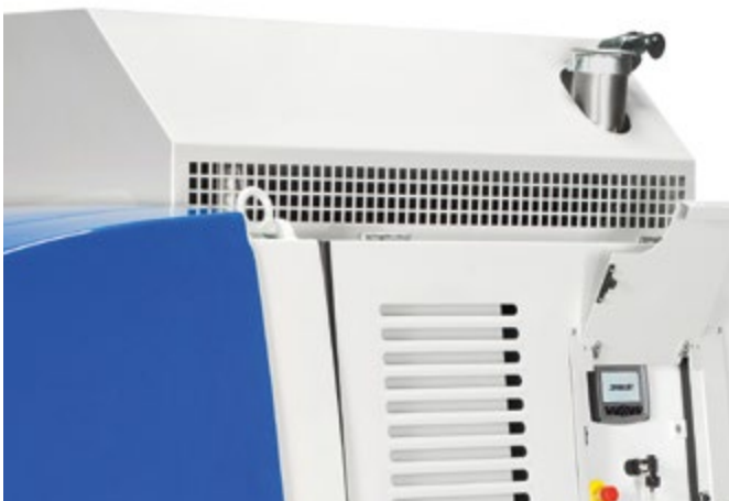
最新的排放标准: 遵守 TIER 4f; i集成火花阻火器 移动方便: