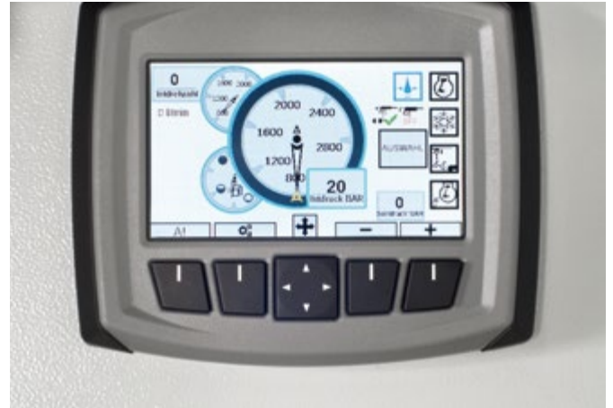
DYNAJET 易控制: 带触摸屏和彩色显示的创新控制